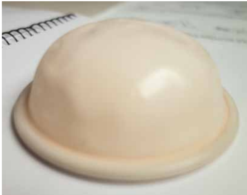
(échelle = environ 7 cm de diamètre)

et la cape cervicale. Ces contraceptifs agissent comme des barrières qui bloquent les spermatozoïdes et les empêchent d'atteindre l'utérus. Comme le diaphragme et la cape cervicale ne sont pas des moyens contraceptifs très fiables, il est recommandé d'appliquer systématiquement du gel spermicide en complément. Malgré l'application de ce gel, leur fiabilité est moins élevée que les autres moyens contraceptifs.